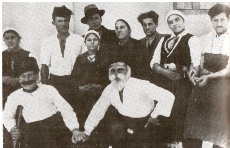
Представяне на драмата „Бойка“ на 7 януари 1938 г.

През 1919/1920 г. е представена трагедията „Многострадална Геновева“. След нея следват пиесите: „Илю войвода“, „Гален син“, „Люти клетви“, „Делото на дявола“, „Бай Ганю“, „Вражалец“, „Вампир“, „Майстори“, „Индже войвода“, „Иванко“, „Селски годеж“ и др.