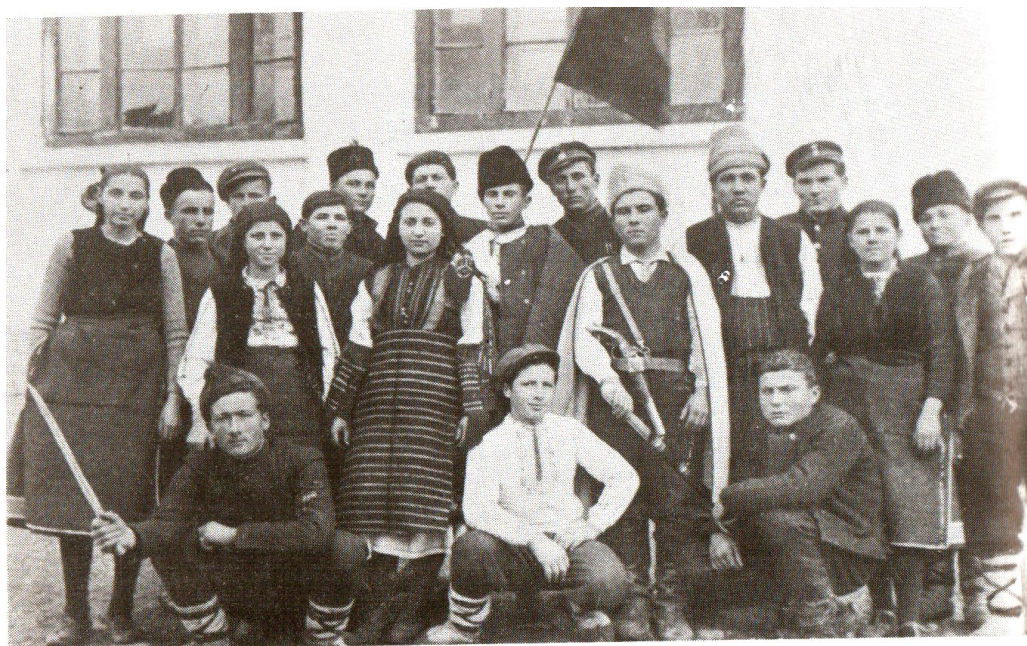
Младежка самодейна театрална група към читалище „Просвета“ 1943 г.